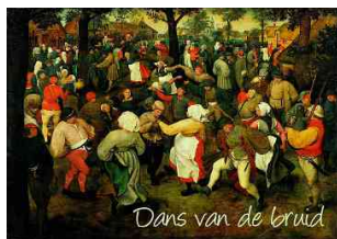
Dans van de bruid

Aflevering 2 – Jan Steen, zie ook pag. 27