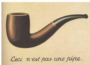
Ceci n'est pas une pipe.